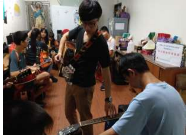
吉他成長團體-鹽埕