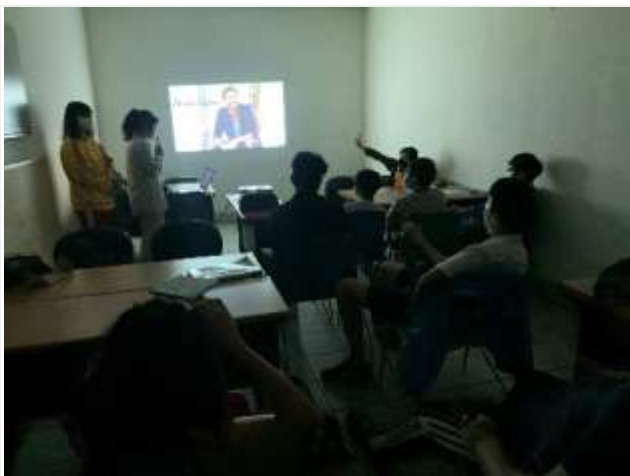
職涯體驗及探索-凹子底