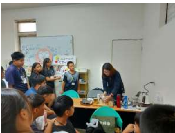
職涯體驗及探索-旗津