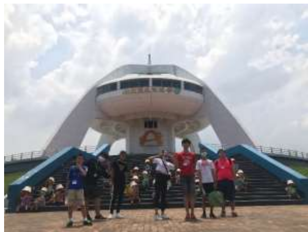
暑期自立營隊-全據點