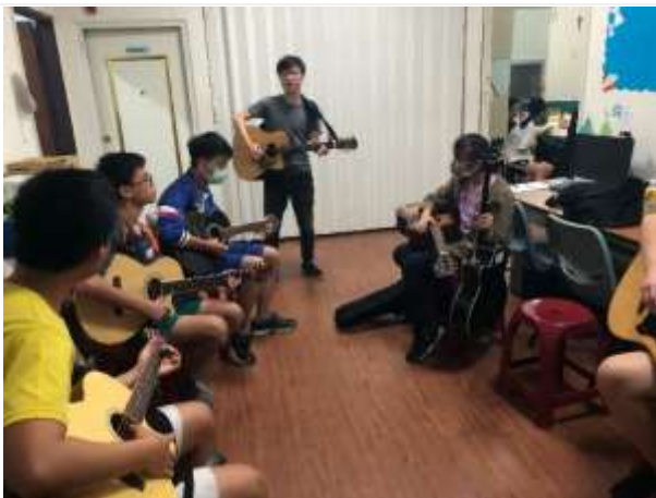
吉他成長團體-鹽埕