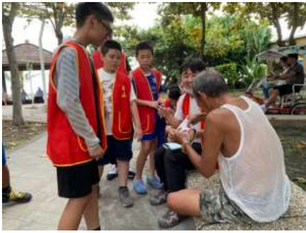
社區探索與服務-旗津