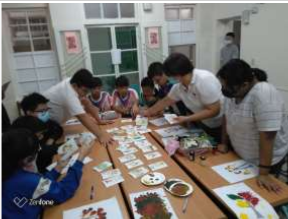
職涯探索成長團體-旗津