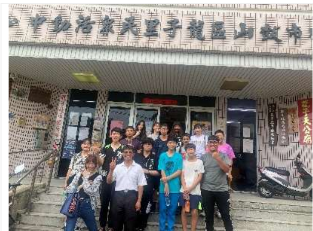
社區探索與服務-凹子底