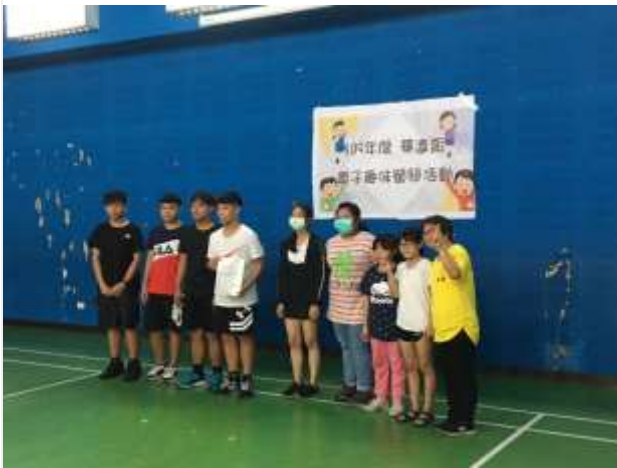
華遠盃親子活動-全據點