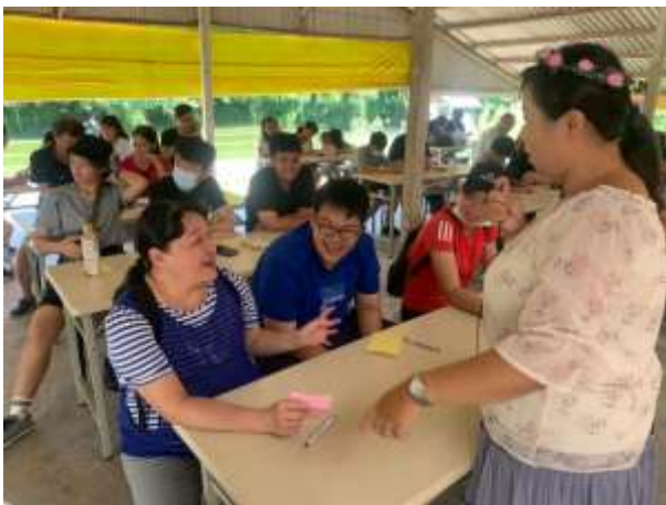
親子活動/親子教育-前峰