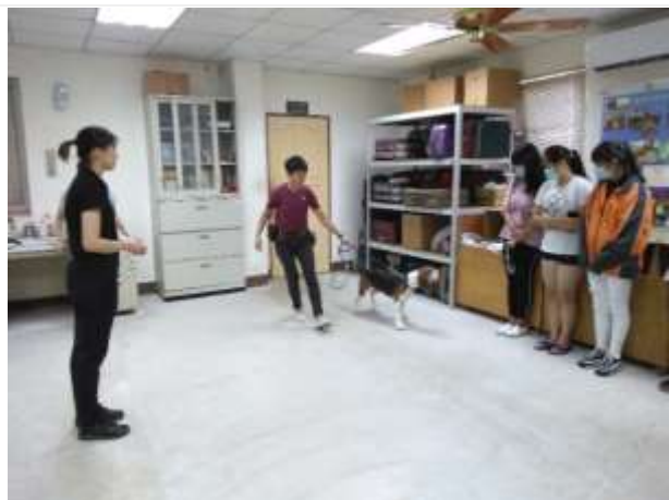
職涯體驗及探索-鹽埕