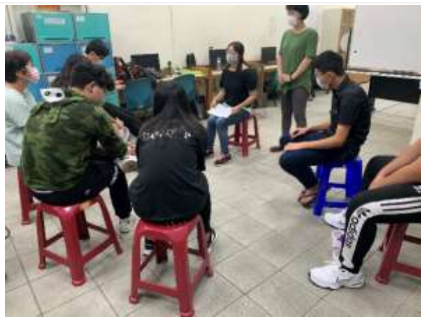
親子活動/親子教育-凹子底