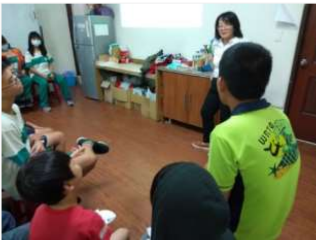
預防性宣導-鹽埕鼓小