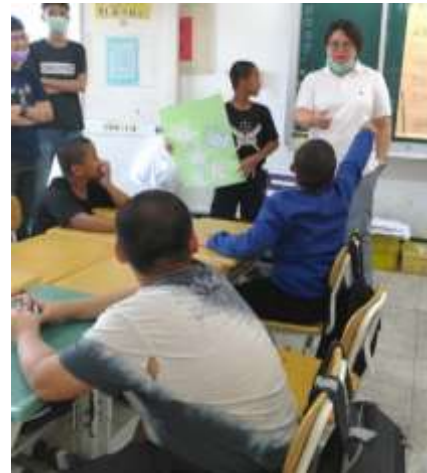
人際關係成長團體-鼓小