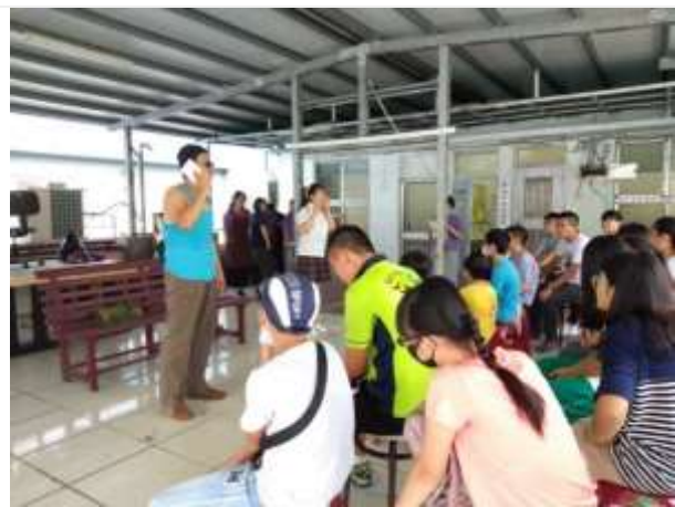
預防性宣導-鹽埕鼓小