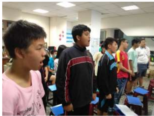
合唱團成長團體-前峰