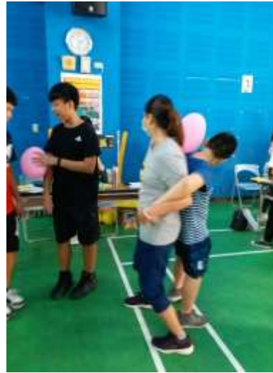
華遠盃親子活動-全據點