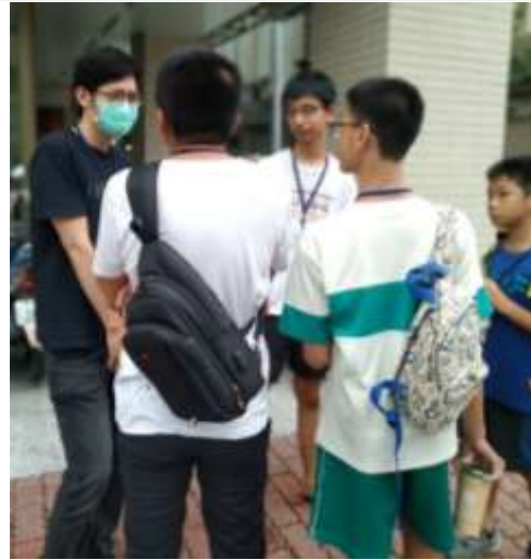
社區探索與服務-鹽埕鼓小