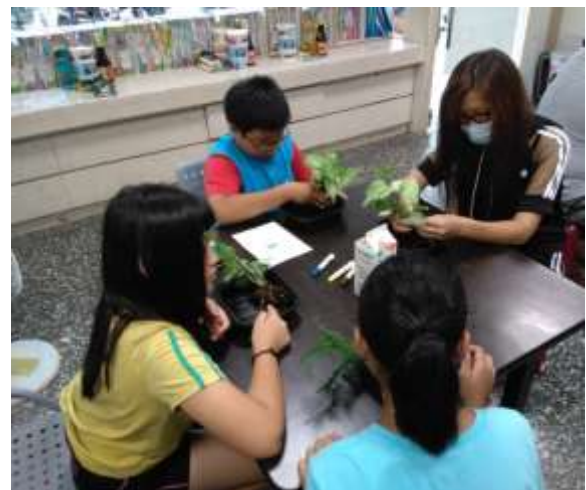
親子活動/親子教育-前峰