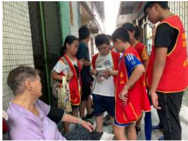
社區探索與服務-旗津