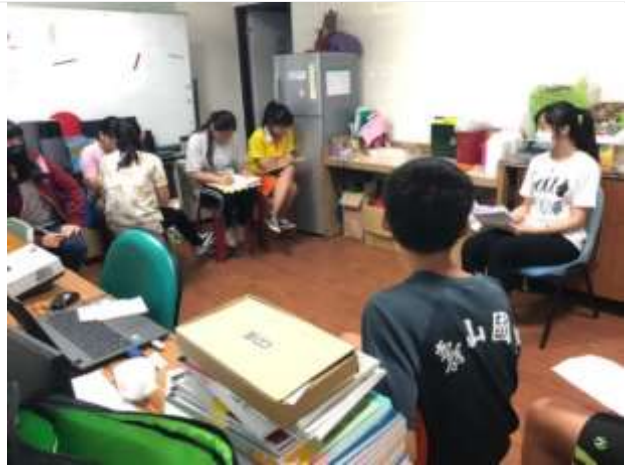
影片賞析與討論-鹽埕