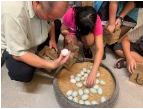
親子活動/親子教育-凹子底