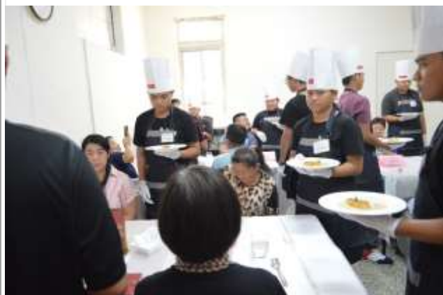
烹飪成長團體-旗津