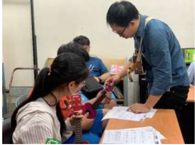
烏克麗麗成長團體-凹子底