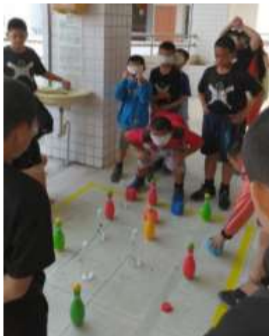
人際關係成長團體-鼓小