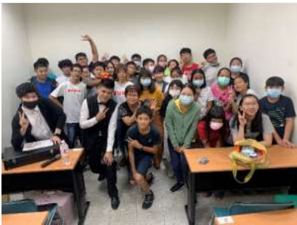
職涯體驗及探索-凹子底