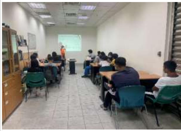
預防性宣導-凹子底