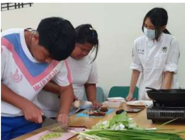
烹飪成長團體-旗津