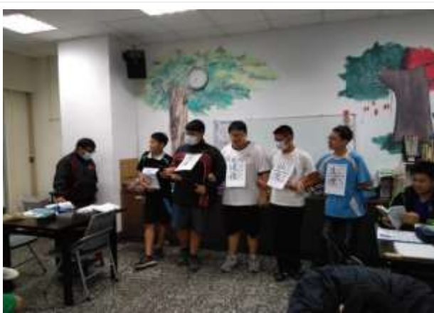
青少年情感教育成長團體-前峰