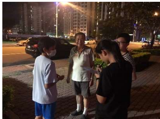
社區探索與服務-凹子底