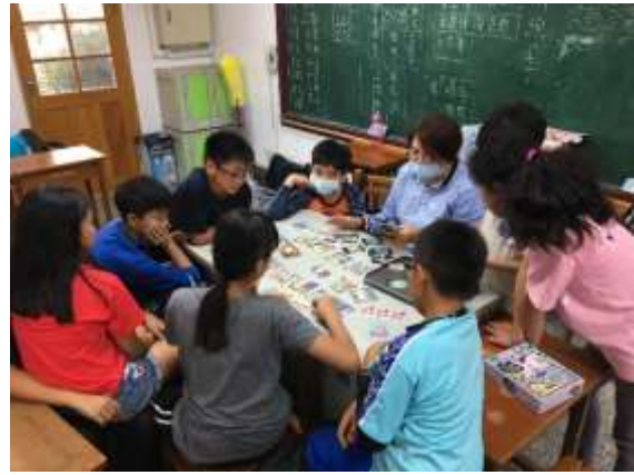
正向溝通成長團體-旗小