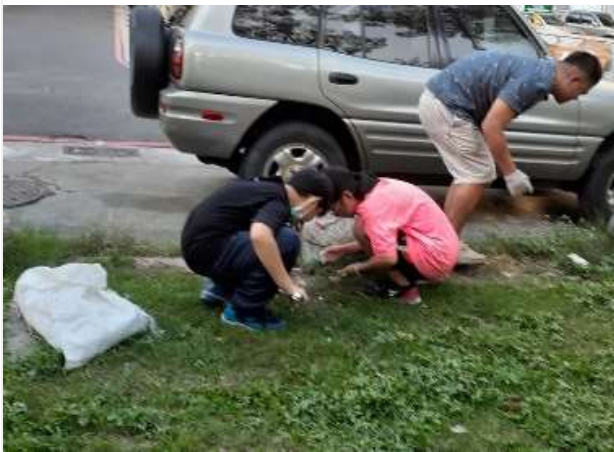
社區探索與服務-前峰