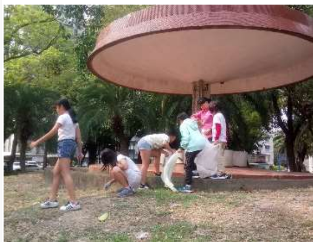
社區探索與服務-前峰