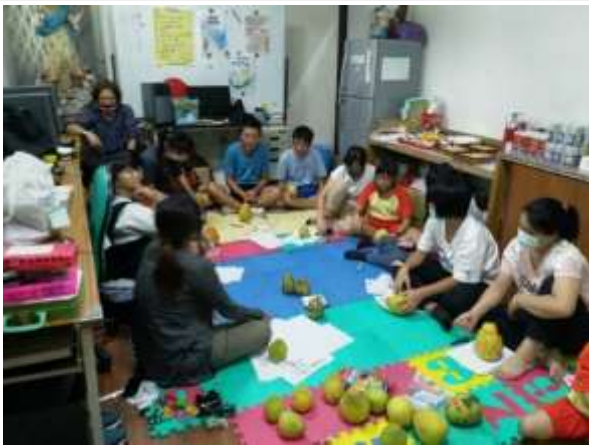
親子活動/親子教育-鹽埕鼓小