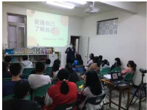
親子活動/親子教育-旗津