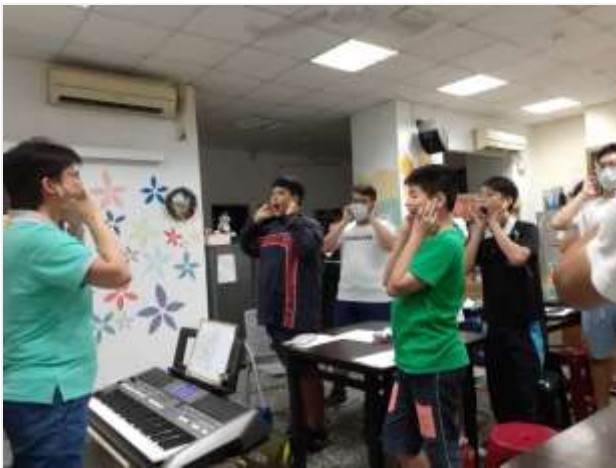
合唱團成長團體-前峰