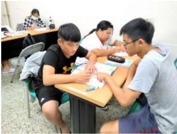
旗津據點課輔—國高中