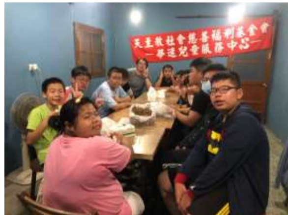
職涯探索成長團體-旗津