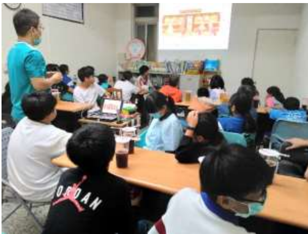
親子活動/親子教育-旗津