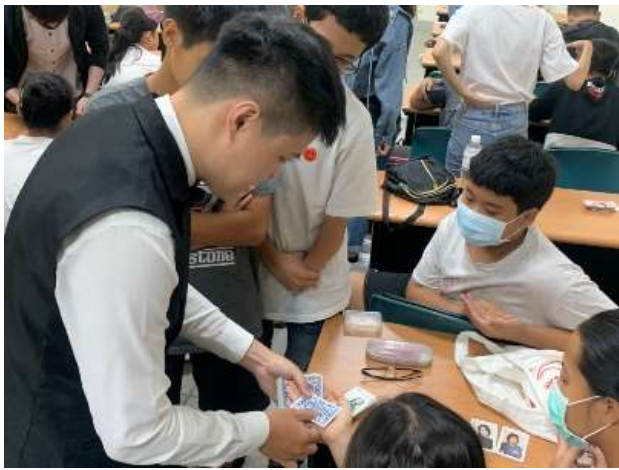
職涯體驗及探索-前峰