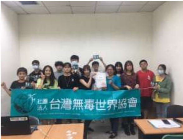
預防性宣導-凹子底