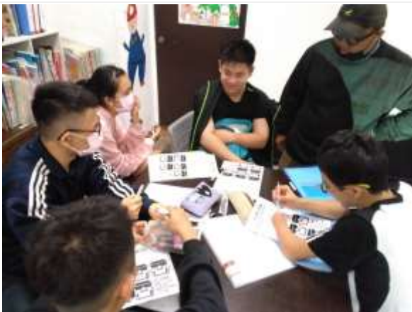
青少年情感教育成長團體-前峰