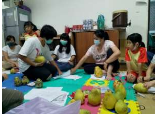
親子活動/親子教育-鹽埕鼓小