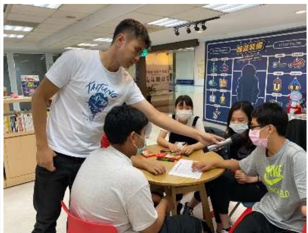
職涯體驗及探索-前峰