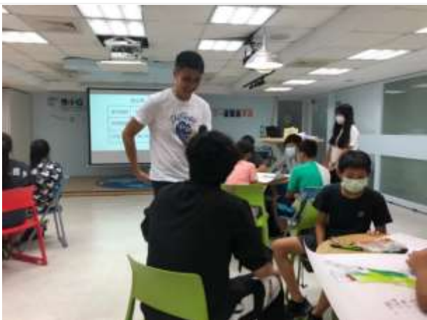
職涯體驗及探索-鹽埕鼓小