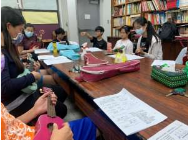
烏克麗麗成長團體-凹子底