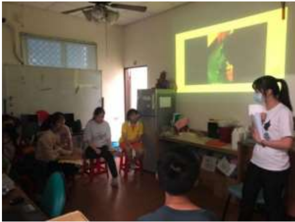
影片賞析與討論-鹽埕