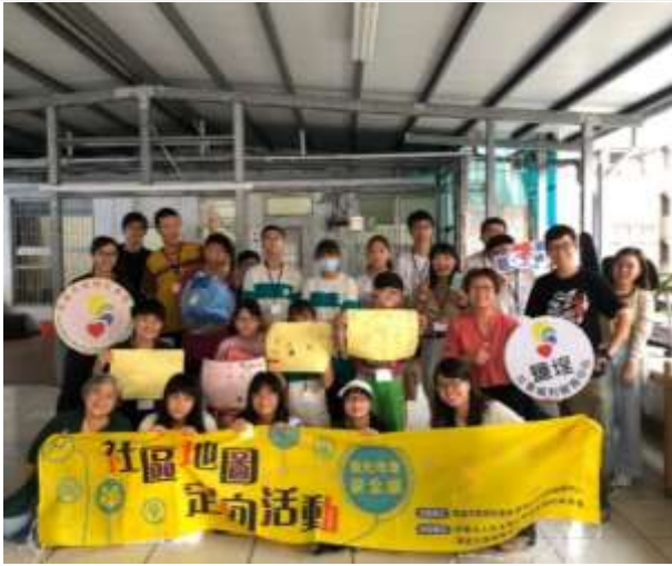
社區探索與服務-鹽埕鼓小