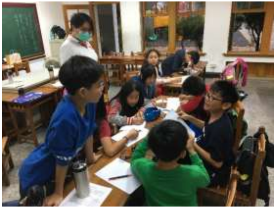
正向溝通成長團體-旗小