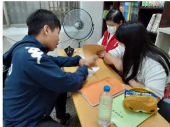
旗津據點課輔—國高中