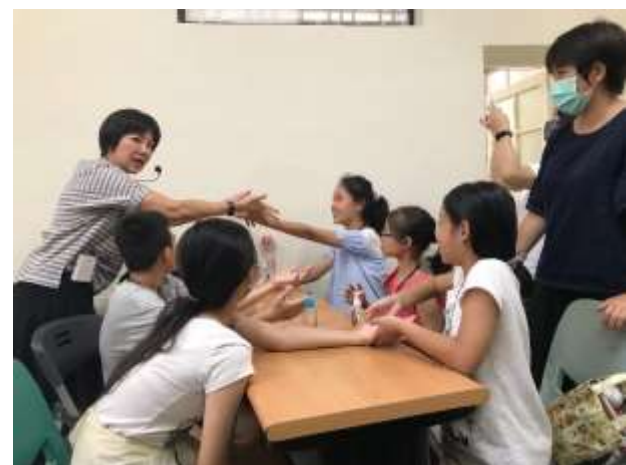
職涯體驗及探索-旗津