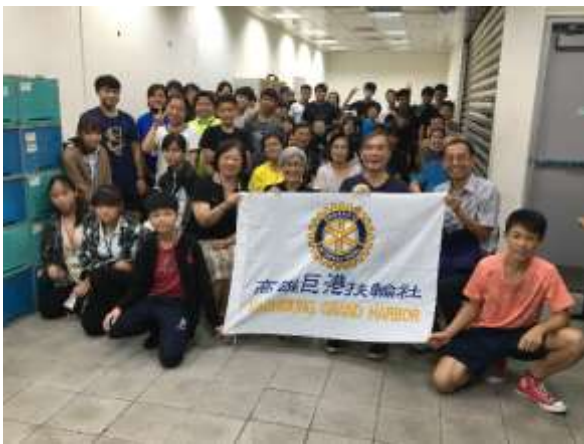
暑期自立營隊-全據點